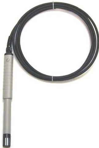
Model HMP45C.